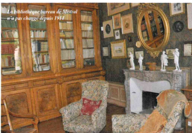
La bibliothèque bureau de Mistral n'a pas changé depuis 1914